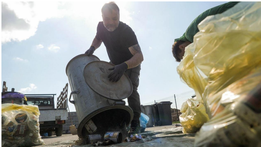
Fyzická analýza odpadu v obci Veľké Turovce