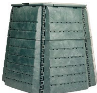
JRK SMART 1100