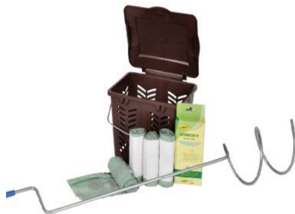
JRK KOMPOSTOVACÍ SET