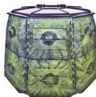
JRK PREMIUM 2000