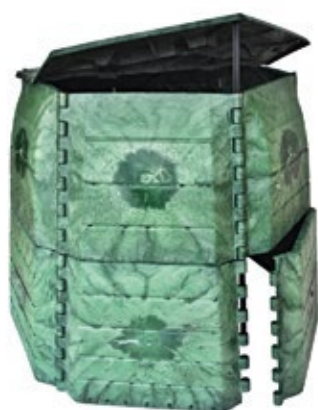
JRK PREMIUM 1050